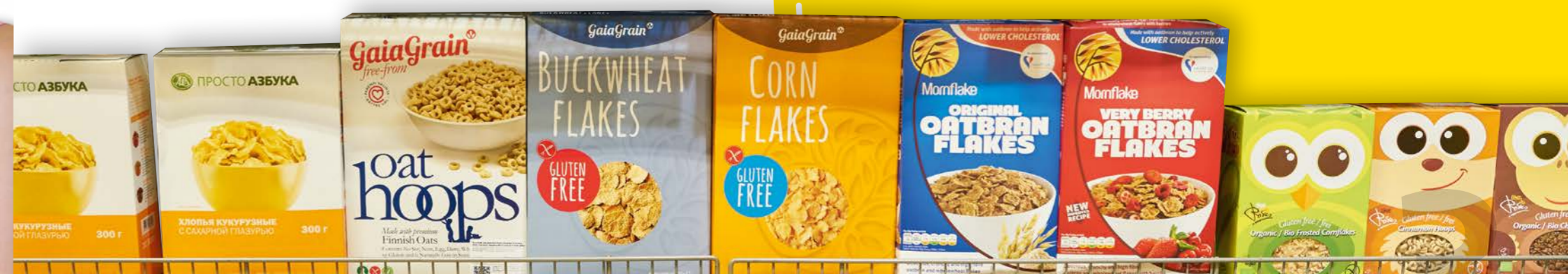
Der Nutri-Score erleichtert die Orientierung in der Vielfalt der Produkte