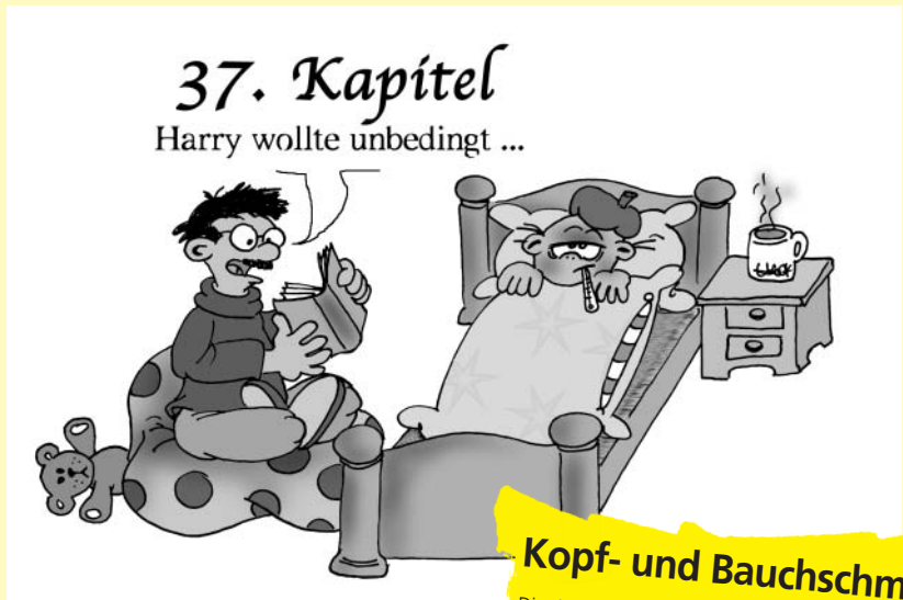
37. Kapitel Harry wollte unbedingt ...

Ein wichtiger Beitrag zur Gesundheitsförderung und damit zur Suchtvorbeugung ist es, die Verantwortung für die eigene Gesundheit aktiv wahrzunehmen. Eltern können Kindern schon von Anfang an vermitteln, wie sie ihr körperliches Wohlbefinden durch eigene Aktivitäten und meistens auch ohne Medikamentengabe verbessern können.